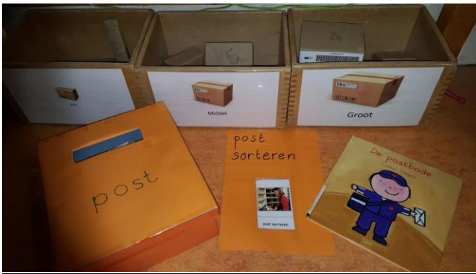
De pakjes zijn inmiddels gesorteerd