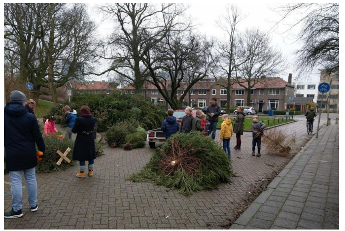
Ouders en kinderen brengen de bomen naar school

De actie is een initiatief van de gemeente Leeuwarden. Door de bomen in te zamelen wordt voorkomen dat ze op verschillende plekken verbrand worden. Deze "onschuldige" brandjes veroorzaken soms voor duizenden euro's schade aan bijvoorbeeld wegdek of plantsoen. De ingezamelde bomen worden versnipperd en gecomposteerd.